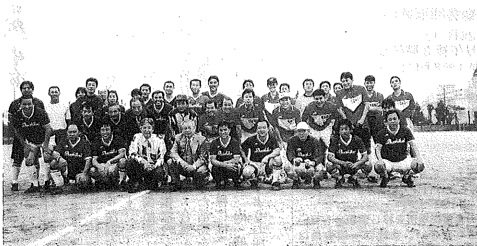
文化祭 同窓会・習志会・学校の懇親サッカー試合

分や家庭を見直し、余暇時間増加に対して地域社会の交流や貢献を勧められようとしている今、母校の変化変遷をご覧になり、恩師や学友との再会、先輩、後輩が交わる楽しい語り、青春の思い出探し等々、大いに同窓会を利用し活用し楽しんでください。